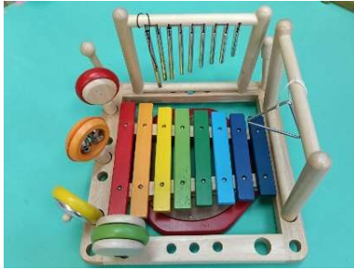
① 木の楽器おもちゃ